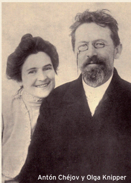
Antón Chéjov y Olga Knipper

Justo cuando el espectador corre el riesgo de encariñarse demasiado con un personaje, una situación inesperada se interpone: nada es estable. Chéjov representa a los individuos y a la sociedad en estado de cambio perpetuo, es el dramaturgo del movimiento de la vida, a la vez sonriente y serio, entretenido y fuerte.