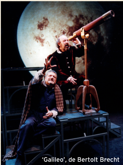
'Galileo', de Bertolt Brecht

L'OM-Imprebís es una compañía teatral española con una larga trayectoria, que ha puesto en escena un amplio repertorio que abarca desde los grandes textos de la dramaturgia universal ( Galileo , de Brecht ; Quijote , de Cervantes ; Calígula , de Camus , o Tío Vania , de Chéjov ) hasta espectáculos como Los mejores sketches de Monty Python o Imprebís , que, estrenado en 1994, se convirtió en el espectáculo de improvisación pionero en España.