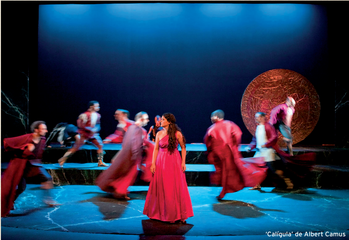
'Calígula' de Albert Camus