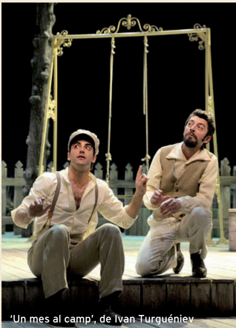
'Un mes al camp', de Ivan Turguéniev

Actor i director de referència en el teatre valencià de les últimes dècades.