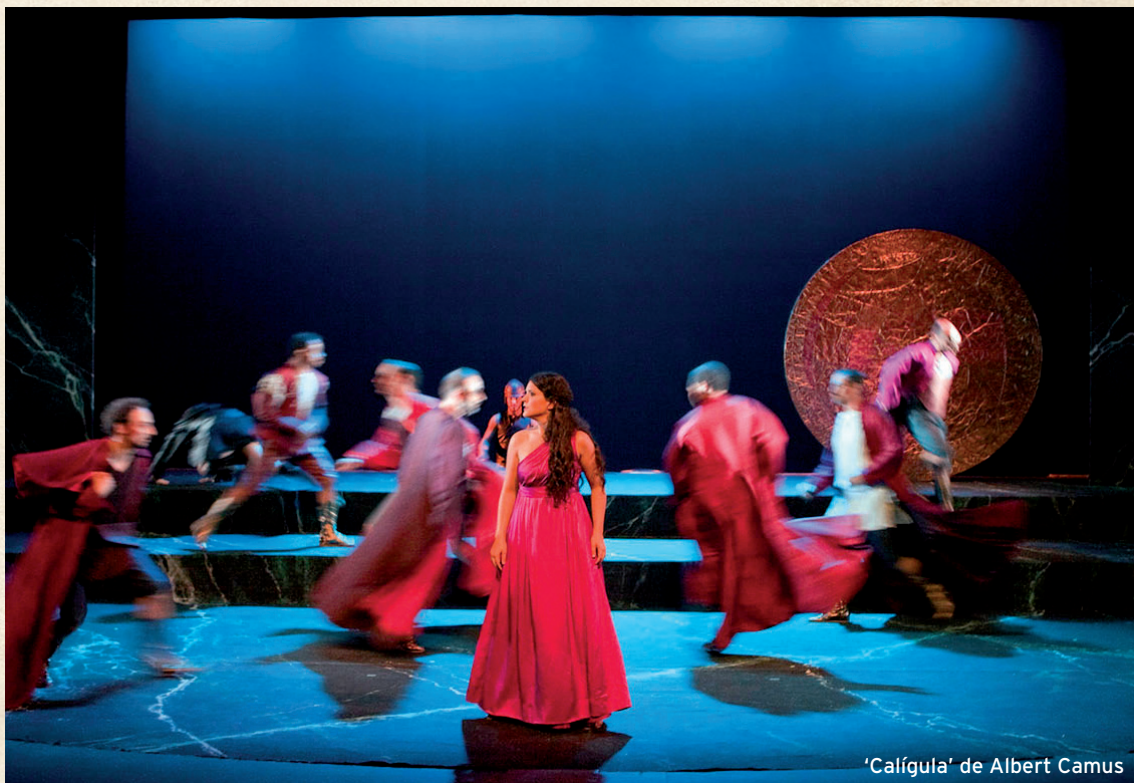
'Calígula' de Albert Camus