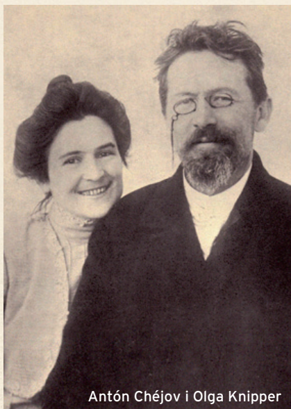
Antón Chéjov i Olga Knipper

Just quan l'espectador corre el risc d'encapritxar-se massa amb un personatge, una situació inesperada s'interposa: res és estable. Chéjov representa als individus i a la societat en estat de canvi perpetu, és el dramaturg del moviment de la vida, alhora somrient i seriós, entretingut i fort.