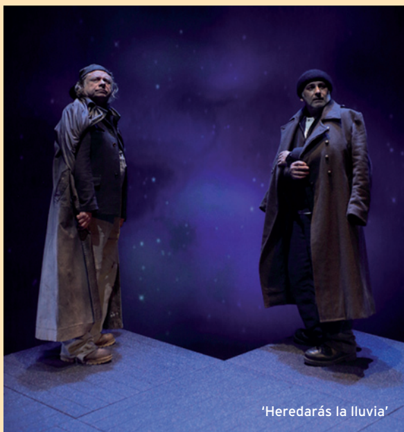
'Herederás la lluvia'

Dirigida por Santiago Sánchez, desde su fundación en los años ochenta la compañía ha consolidado no solo una marca de producción, sino el trabajo conjunto de un núcleo estable de actores y creativos, compuesto por más de treinta personas de distintas nacionalidades. Su trabajo artístico se ha diversificado desde los grandes textos clásicos hasta la improvisación en vivo;